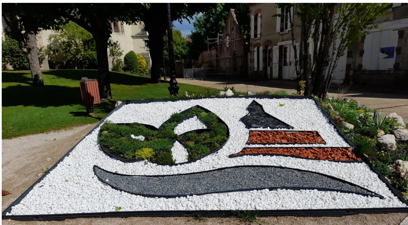
Logo végétal et minéral de Pierrefitte en face de la boulangerie

Directeur de la publication : Bernadette Courrioux, Maire ; Rédaction : Pirkko Turunen avec la Commission Communication Mise en page : Pirkko Turunen ; Imprimé à la Mairie